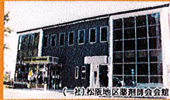
(一社)松阪地区薬剤師会会館

在宅医療において薬剤師には、薬学的管理、処方提案、服薬支援や残薬の解消など、幅広く専門性が求められており、多職種と連携して患者様の情報を共有し、患者様が安心して自宅で療養できるように、薬剤師の役割と責任を果たせるよう努めています。